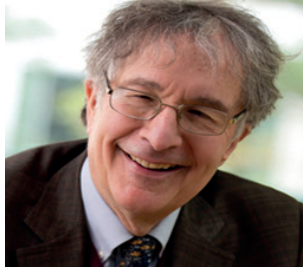
Prof. Dr. Howard GARDNER (Guest of Honor)

Üsküdar Üniversitesi Kurucu Rektör / Founding Rector / President of Congress “Trauma Sonrası Büyüme” / “Post-Traumatic Development”